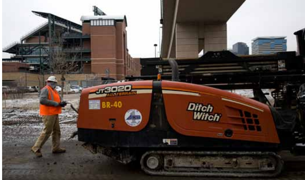
Los trabajadores de construcción han comenzado la reubicación de uno de los principales cables de fibra óptica de la línea Este del tren suburbano de RTD que llegará al aeropuerto internacional de Denver.

El Consejo de Administración entiende plenamente el entorno económico actual y los retos que conlleva, y los analiza con sus socios regionales antes de tomar una decisión final sobre los pasos más acertados que se deben llevar a cabo para que el proyecto FasTracks siga adelante.