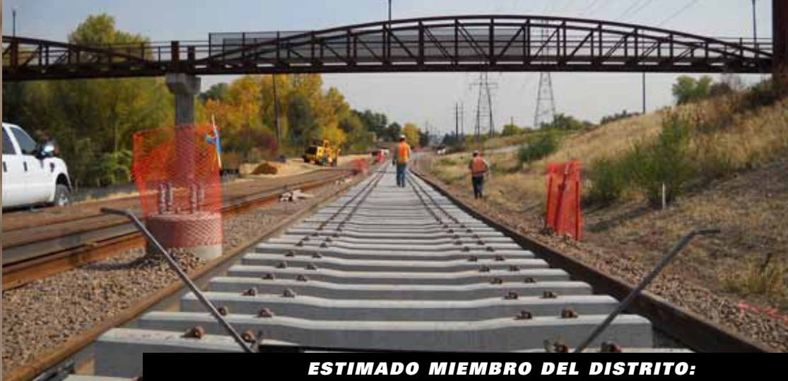
Cuadrillas de trabajadores instalan las vías del tren ligero en el Corredor del oeste.